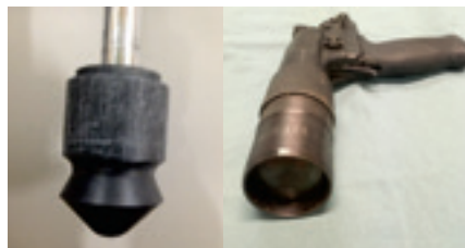
Tiges non perforantes : conique et plate.

Pour les pistolets percuteurs à tige perforante, le point de contact se fait à environ 1 à 2,5 cm au-dessus de la ligne des sourcils. Il faut tenir le pistolet avec un angle pour l'orienter en direction de la colonne vertébrale (queue). Si vous visez le plan-