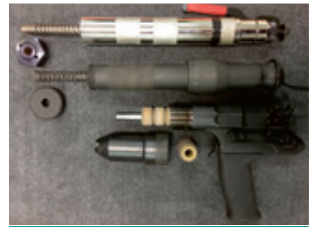
Trois pistolets à tige perforante.

cher, vous risquez d'effleurer le cerveau et de ne pas réussir. Il est très important d'avoir un bon appui du pistolet sur le front de l'animal afin d'éviter le contre-coup lors du tir, car la tige frappe une surface osseuse dure et l'impact est surprenant.