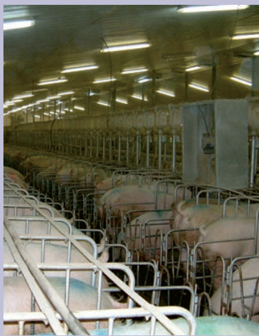
Gros ventilateurs installés dans une gestation de huit rangées de largeur, à différents endroits stratégiques pour permettre une circulation d'air plus rapide (Ferme Porc-Saint SENC.)