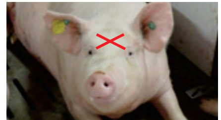
Le point de contact est à la croisée des lignes diagonales passant par le haut des oreilles et l'intérieur des yeux.

cher, vous risquez d'effleurer le cerveau et de ne pas réussir. Il est très important d'avoir un bon appui du pistolet sur le front de l'animal afin d'éviter le contre-coup lors du tir, car la tige frappe une surface osseuse dure et l'impact est surprenant.