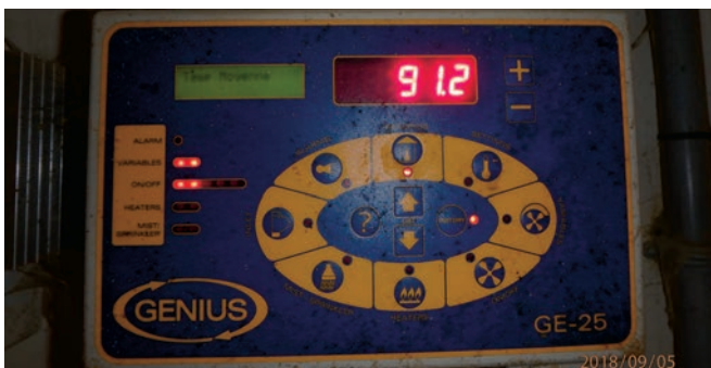
Température ambiante prise en mise bas lors de la canicule, le 5 septembre 2018.

Les performances des porcs sont altérées lorsque la température et l'humidité s'élèvent. D'une manière générale, cela se traduit par une diminution du gain moyen quotidien (GMQ) pour les porcs en engraissement, une diminution de la production laitière pour la truie en mise bas et une diminution du taux de fécondité pour la truie en gestation. En période de canicule, une augmentation de la mortalité peut également être observée, particulièrement chez les truies. La chaleur intense peut donc avoir des conséquences économiques importantes pour les éleveurs porcins. Aux États-Unis, les pertes annuelles pour l'industrie porcine sont chiffrées à plus de 300 millions de dollars.