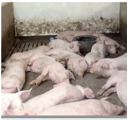
Porcs d'engraissement bien étendus dans le parc pour perdre le plus de chaleur possible par contact avec le plancher.