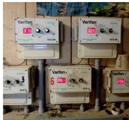
Température ambiante dans l'engraissement le 6 août 2018 au même moment que les photos précédentes.

Le tableau 1 rappelle les principaux signes d'inconfort thermique des porcs dans les bâtiments d'élevage. Afin de soulager les porcs, le tableau 2 présente quelques suggestions de mesures à mettre en place lors de températures chaudes.