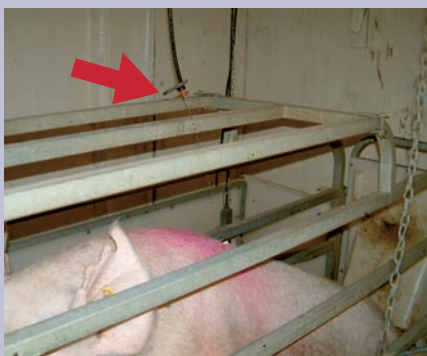
Truie en mise bas qui est arrosée par une petite buse (à l'extrémité de la flèche) installée au-dessus de la cage au niveau des épaules.

C'est un système d'irrigation individuelle installé au-dessus de la truie et orienté pour tomber sur le dos entre les deux épaules. Il est ajusté à un thermostat et à une minuterie. Il rafraîchit les truies même dans les périodes très humides. Il a cependant les inconvénients d'augmenter la consommation d'eau, de ne pas tomber nécessairement au bon endroit sur la truie et de mouiller les porcelets sous les mères.