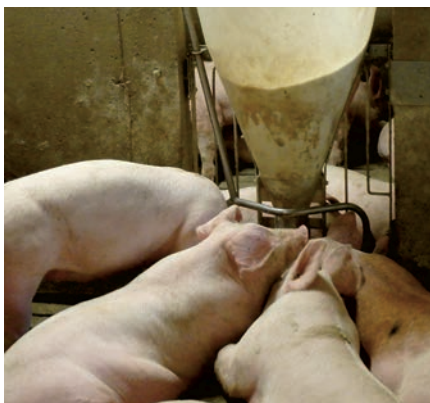
Porcs d'engraissement étendus avec leur tête en contact avec la trémie-abreuvoir pour se rafraîchir.

vraiment temps d'intervenir. Si elle a les yeux rouges, c'est une urgence! De plus, n'oubliez pas que la truie en mise bas qui est couchée sur un plancher de plastique ne peut pas transférer autant de chaleur au plancher que s'il est en métal. En pouponnière et en engraissement, les porcs ont aussi tendance à jouer dans l'eau, se coucher dans les zones mouillées et parfois s'appuyer sur la trémie-abreuvoir et les bols d'eau.