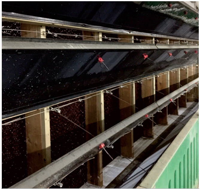
Entrée d'air par refroidissement d'air, dit cooling pad , associée à une ventilation tunnel modifiée dans une gestation (Ferme Saint-Dominique).

À la ferme Saint-Dominique de F. Ménard Inc. (maternité de 2 600 truies), la grande section de gestation fonctionne avec un système combiné. Julie Ménard, médecin vétérinaire responsable de cette ferme, est très satisfaite des avantages de ce système combiné. L'été dernier, la température était de 10 à 12°F moindre que la température ambiante extérieure. Le déplacement d'air est important sur toute la longueur du bâtiment. Le fait que les divisions entre les parcs de truies de gestation soient ajourées contribue à la circulation de l'air. Elle note aussi que la décision d'offrir une superficie de 22 pieds carrés par truie en parc de gestation est avantageux en été. Elle permet de donner aux animaux plus d'espace et le choix de l'aire de couchage en période chaude. Fait intéressant à considérer, au cours de l'été dernier, il n'y a que deux truies qui sont mortes de chaleur dans la gestation, et ce fut pendant une période de bris du système. Autres points intéressants, les performances de reproduction sont restées stables, et c'est la ferme Saint-Dominique qui a consommé le moins d'eau au cours de l'été en comparaison avec toutes les fermes du réseau de production. Les truies, en étant confortables, boivent et gaspillent moins d'eau.