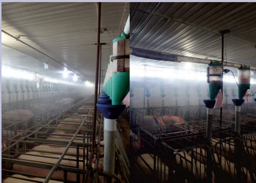
Vue de côté et de face dans une gestation utilisant un brumisateur (Ferme FM Blanchard inc.).

La disposition des brumisateurs peut varier d'un bâtiment à l'autre, certains sont installés dans la prise d'air de chaque mise bas et créent moins de désagrément.