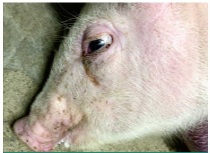
Réflexe pupillaire : la pupille des yeux est dilatée et ne se referme pas si vous l'exposez à la lumière de votre cellulaire.